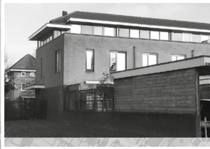
Fruitlaan nu vanuit de Morelstraat