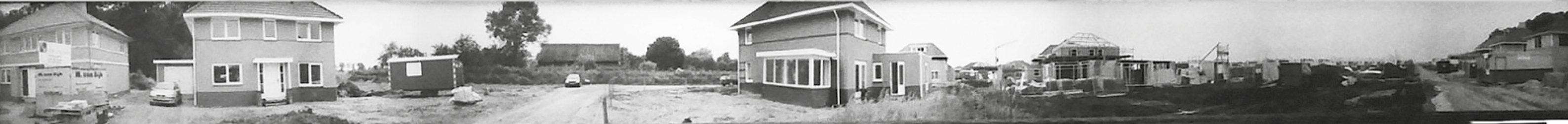
Van af links: - De boerderij van dhr Hupkes, thans de huisartsen praktijk. Dan in het midden Annabellastraat nr.13 Daar achter nr 9 in aanbouw. Beetje naar rechts Hofkersstraat 6 en een begin van nr 4. Dan helemaal rechts weer de Annabellastraat met de nummers 12, 10 en 8. Daar sluit de foto dus weer aan op waarhet begon!