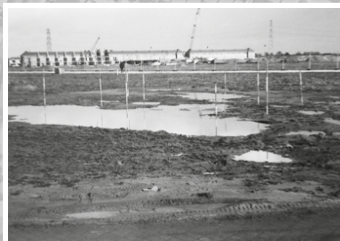
Fruitlaan in zicht 1999