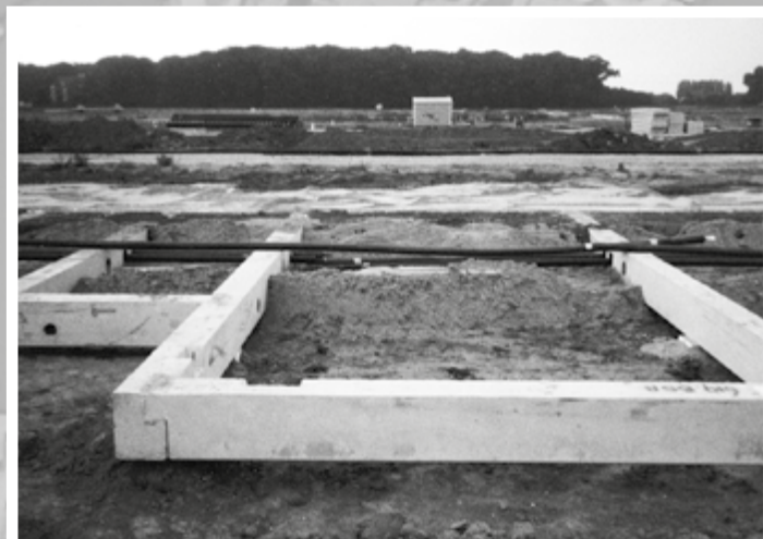
fundering Primusstraat 1999.