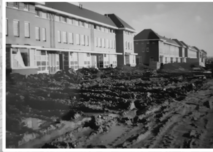
Fruitlaan toen met de aanleg van de busbaan en het fietspad