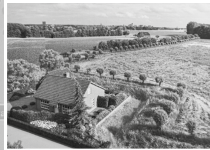
Toen, van Boetzelaerstraat 1A, vergezicht op perenlaantje en Nijmegen.