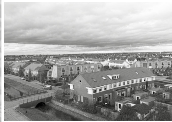
Mooi uitzicht vanuit de flat over de wijk Oosterhout - 2020