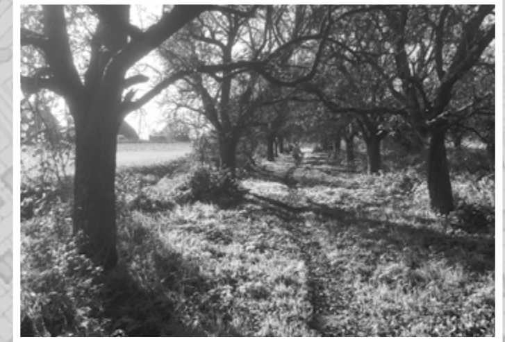
Perenlaantje voor iedereen toegankelijk ( Stichting Cobomen beheert het Perenlaantje en zorgt voor het onderhoud)