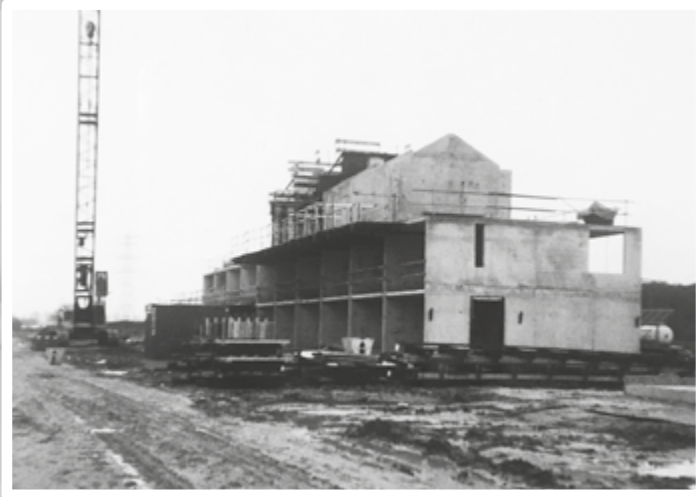
Morelstraat (inmiddels Fruitlaan) in aanbouw