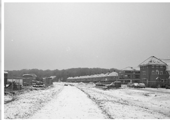
Hoek Fruitlaan/Annabellastraat, eerste sneeuw op de wijk, 2000.