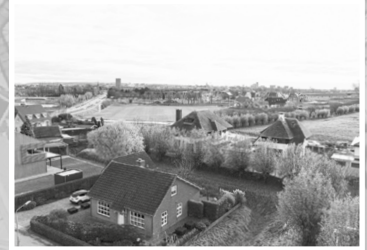
Nu, van Boetzelaerstraat, stukje Park Waaijstein en de nieuwe wijk Woonderskamp in beeld