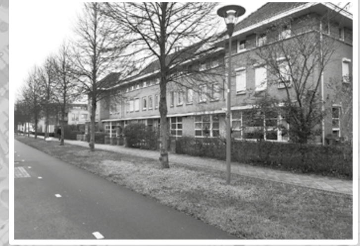
Fruitlaan nu het fietspad richting het winkelcentrum