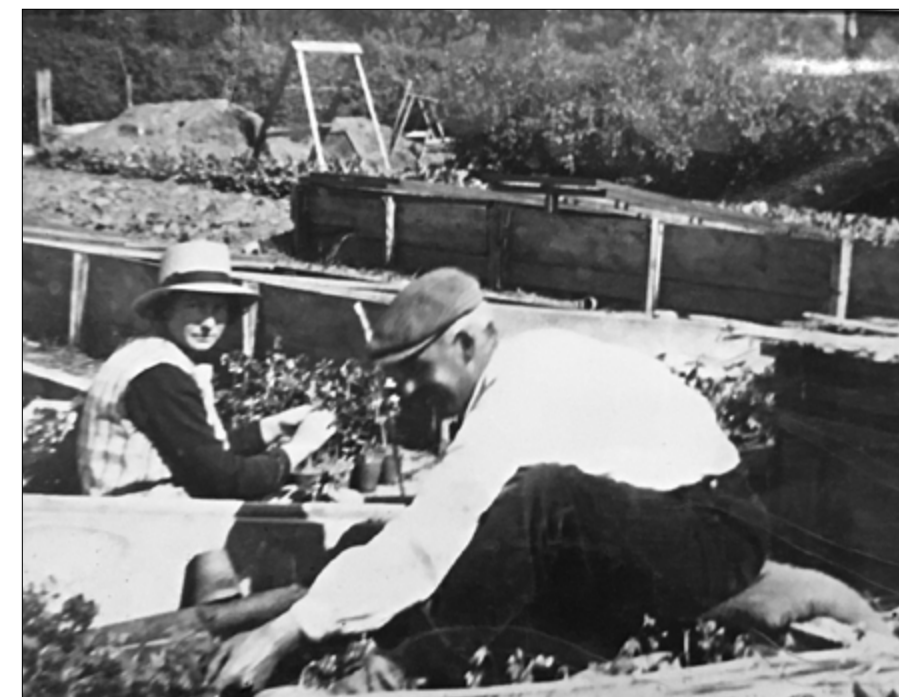
Historische foto uit het archief van de Warmoes

De Warmoes is in de kerstvakantie gesloten.