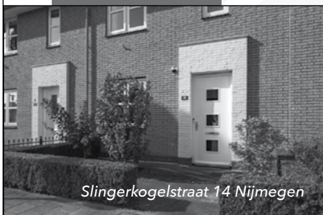
Slingerkogelstraat 14 Nijmegen

Onlangs verkocht door ons kantoor: Golden Deliciousstraat 26 Nijmegen