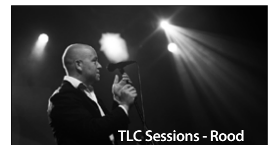
TLC Sessions - Rood