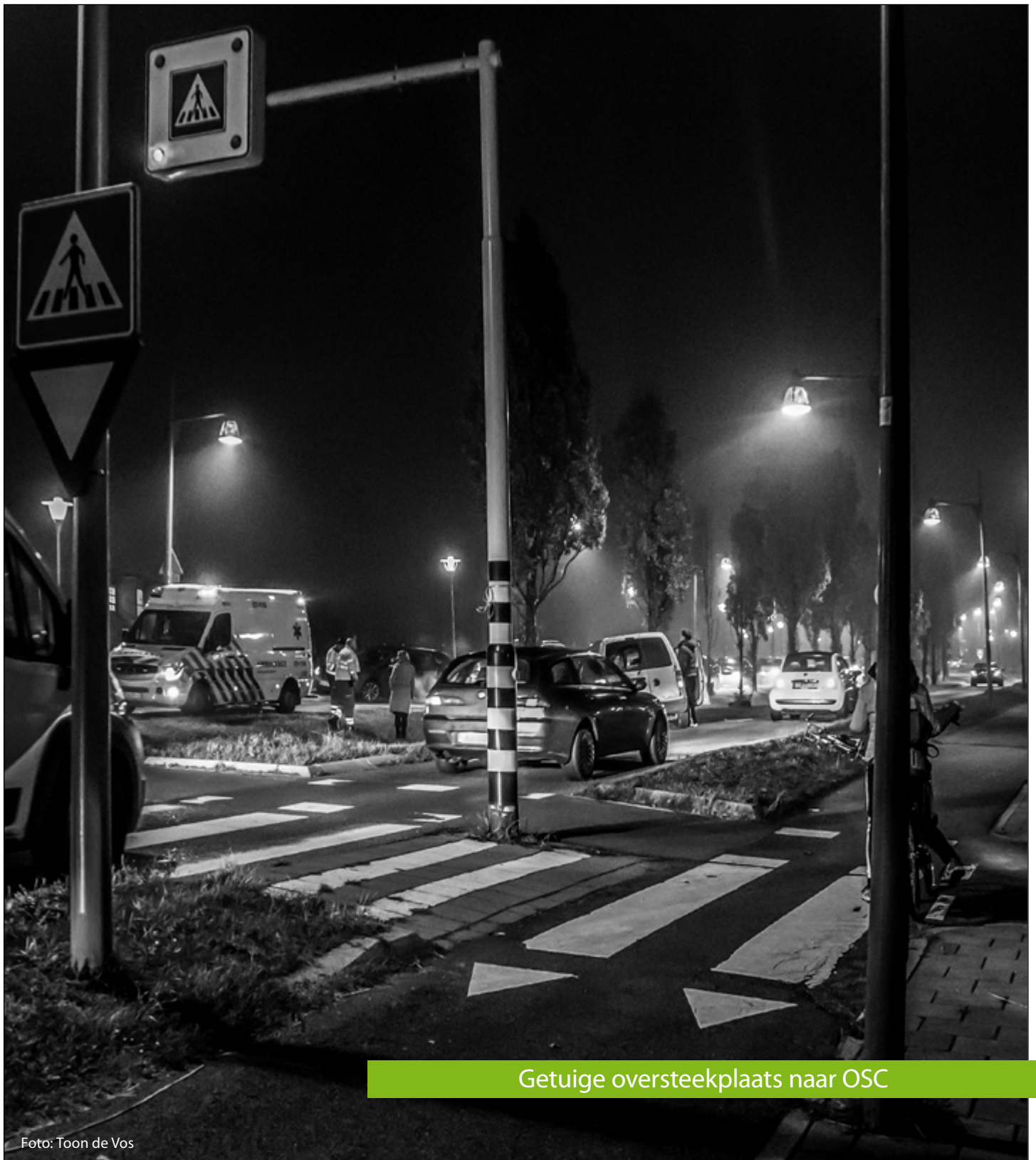
Getuige oversteekplaats naar OSC

WIJKBLAD • NIJMEGEN-NOORD • OOSTERHOUT • JAARGANG 16 • NR 6 • NOVEMBER 2017