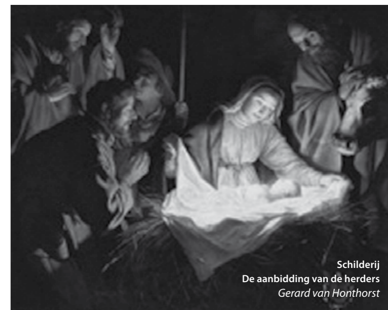
Schilderij De aanbedding van de herders Gerard van Honthorst