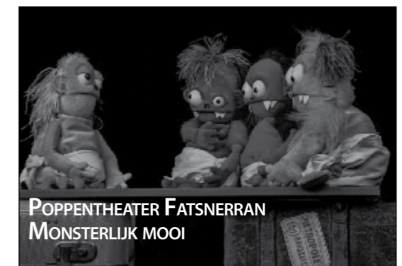
POPPENTHEATER FATSNERRAN MONSTERLIJK MOOI

Krak, krak, kraak ... De familie Monster heeft gezinsuitbreiding. Vier snoezige ... nou ja, snoezige? Vier monsterbaby's. En het valt nog niet mee om je staande te houden in al die drukte. Als iedereen probeert de ander te vlug af te zijn. En te slim... Een voorstelling over erbij willen horen, maar er niet bij passen. Over net even anders zijn. Over eenzaam zijn in de chaos van een groot monstergezin. Waar moet je dan naartoe? En wie bang is voor monsters? 't Zijn nog maar baby's!