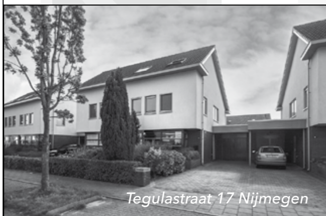
Tegulastraat 17 Nijmegen

Marc Eerden Register Makelaar - Register Taxateur